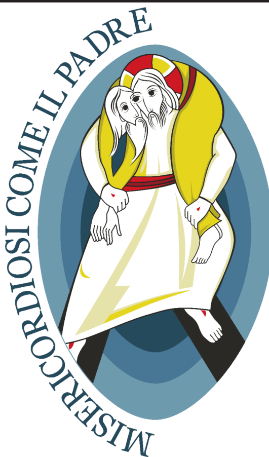
Immagine del Giubileo

In questo Anno Santo la Chiesa è quindi impegnata a riscoprire nella gioia e a rendere feconda nel mondo la misericordia di Dio, con gesti di perdono, di sostegno, di aiuto e di amore, nelle famiglie, nei luoghi di lavoro, nelle comunità parrocchiali, negli oratori e nelle strutture dedicate agli anziani.