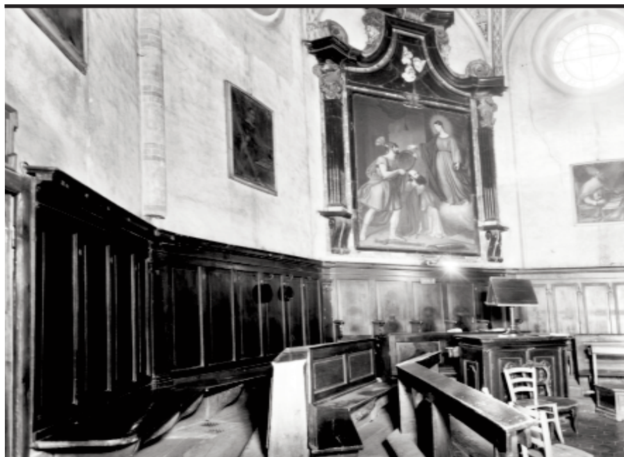
l'abside prima dei restauri del 1973