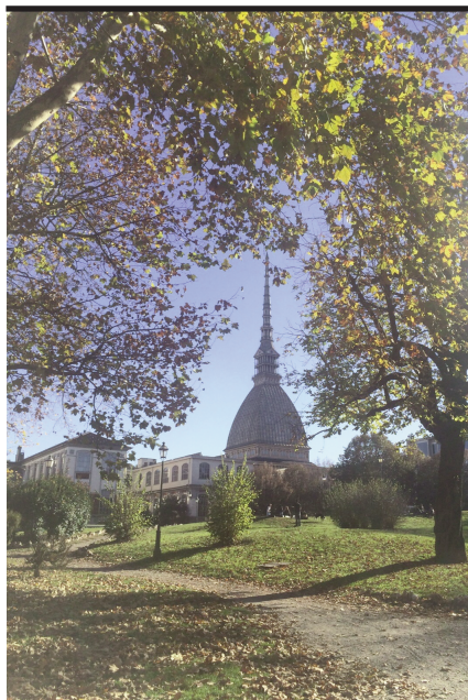
Vista della Mole

I giovani, lavoratori e universitari, dell'oratorio hanno vissuto un fine settimana a Torino nel segno della dedizione e del sacrificio per il prossimo.