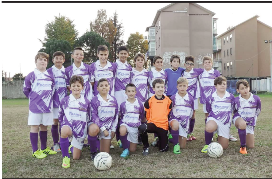
Squadra esordienti Sanmartinese

Successivamente saranno impegnati il 13 a Castelletto Ticino, il 20, in casa, con la Romentine e dopo le feste natalizie riprenderanno il 17 gennaio sul campo del Riviera d'Orta.