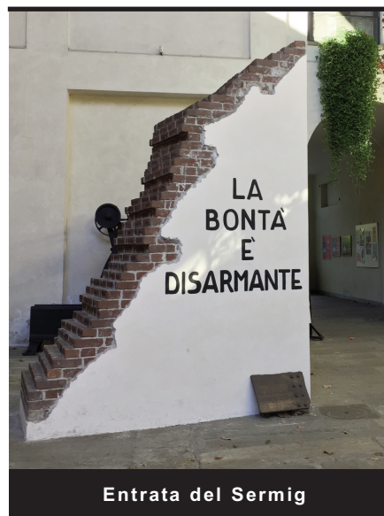
Entrata del Sermig

in una delle sale comuni messe a disposizione dall'oratorio, la sistemazione nelle camerette ed una piccola sosta tra gioco e pennicelle, prosegue la visita nel pomeriggio, con la visita al Santuario della Consolata, conclusasi con la fermata al Caffè "al Bicerin". Dopo le visite guidate, nel tardo pomeriggio viene concesso un po' di tempo libero per permettere ai ragazzi di passeggiare e di ammirare le piazze e i corsi nel centro di Torino. Il gruppo si ricompone alla casa e riparte per andare a cena, svolta in pizzeria tra chiacchiere e risate, per poi concedersi la serata in giro ma, soprattutto, andando a CioccolaTò, la fiera torinese del cioccolato. Dopo un'intera giornata di cammino è ora di riposare in vista della domenica. Domenica che comincia con la visita al Sermig Arsenale della Pace, gruppo fondato nel 1964 da Ernesto Olivero insieme ad alcuni giovani cattolici con lo scopo di combattere la fame nel mondo, promuovere lo sviluppo e praticare la solidarietà verso i più poveri. La visita si