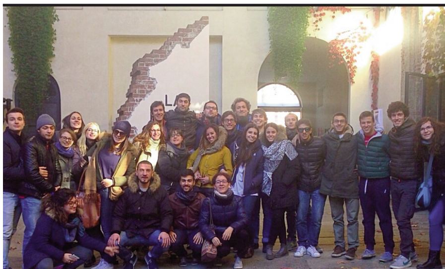
Il gruppo degli universitari al Sermig