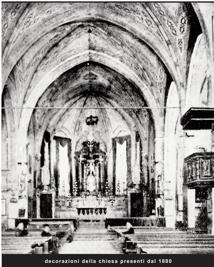
decorazioni della chiesa presenti dal 1880

L'occasione dei restauri di consolidamento dell'abside della nostra chiesa, ci permette di fare un breve excursus sulla storia dei restauri che sono stati eseguiti negli anni.