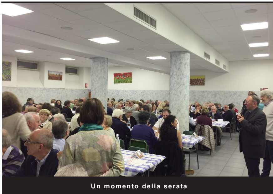
Un momento della serata

Noi volontari vogliamo informarvi, attraverso le pagine del giornalino della nostra Parrocchia, che la Camera di Commercio ha voluto premiare, con un riconoscimento ufficiale, la lunga e meritoria atti-