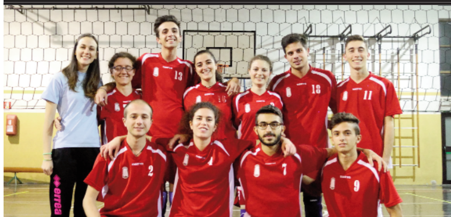
Il team Red del CSI di pallavolo