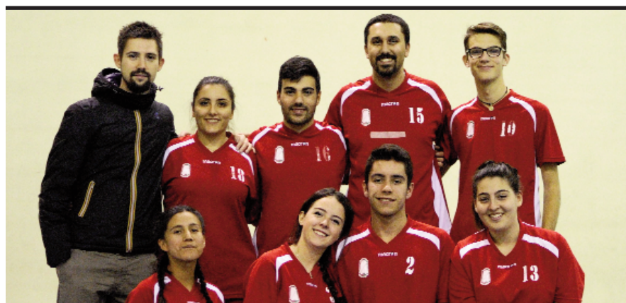
Il team Green del CSI di pallavolo

Campo Comunale di Via Ruzzante (Sant'Andrea) il mercoledì ed il venerdì dalle 20 alle 22