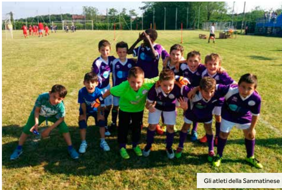
Gli atleti della Sanmartinese

Iniziamo con i più piccoli. La formazione dei 2010 dopo aver vinto il Torneo di Arconate il 1° maggio, sospeso per la pioggia, in base alla classifica stilata da tutti gli allenatori rispetto alla qualità di gioco espresso, si sono comportati ottimamente (vincendo 6 partite su sette) a Robbecchetto domenica 21 maggio e si sono imposti nel Torneo "Mantovani" a Novara aggiudicandosi la finale sull'Olimpia per 5 a 4. A seguire i 2009, vittoriosi anche loro nello stesso torneo novarese imponendosi in