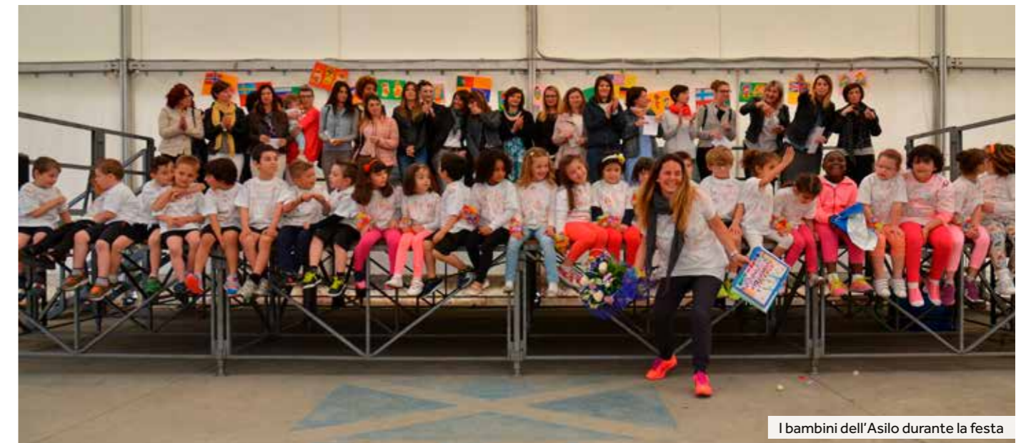
I bambini dell'Asilo durante la festa